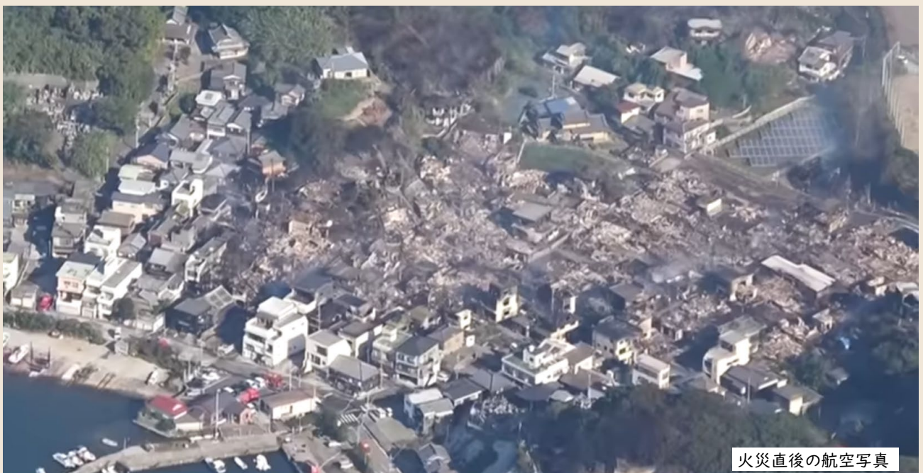
火災直後の航空写真

去る令和7年11月、大分市佐賀関地区を襲った大規模火災は、強風という悪条件も重なり、瞬間に木造住宅密集地を飲み込みました。地域の精神的支柱である神社こそ奇跡的に焼失を免れましたが、その周囲の見慣れた町並みは一変し、住民に深い喪失感を与えています。この災害は、単なる偶発的な事故ではありません。過疎化、高齢化、そして古い木造家屋が密集する日本の地方都市が共通して抱える「構造的な脆弱性」が、最悪の形で顕在化した事例と言えます。本稿では、現地の状況と、その後の復旧プロセスで明らかになった「土地情報のインフラ」としての課題、地籍調査と復興への道筋について報告し、今後の政治連盟としての活動指針を報告します。